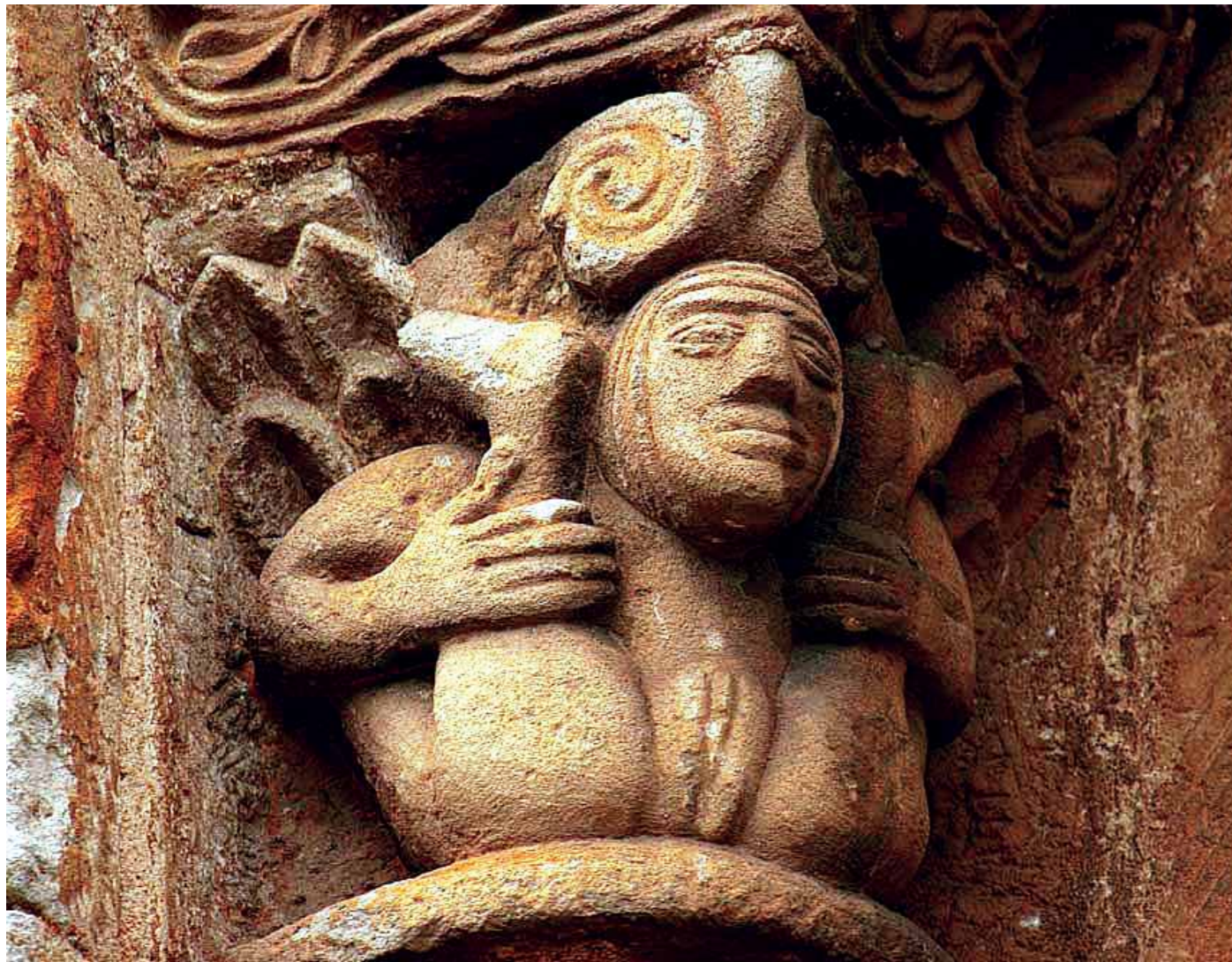
Cervatos, Detalle capitel erótico.

La segunda teoría se halla influenciada por la proximidad del Islam, de Al-Andalus, puesto que gracias a esta religión la sociedad medieval era bastante más liberal y abierta en temas