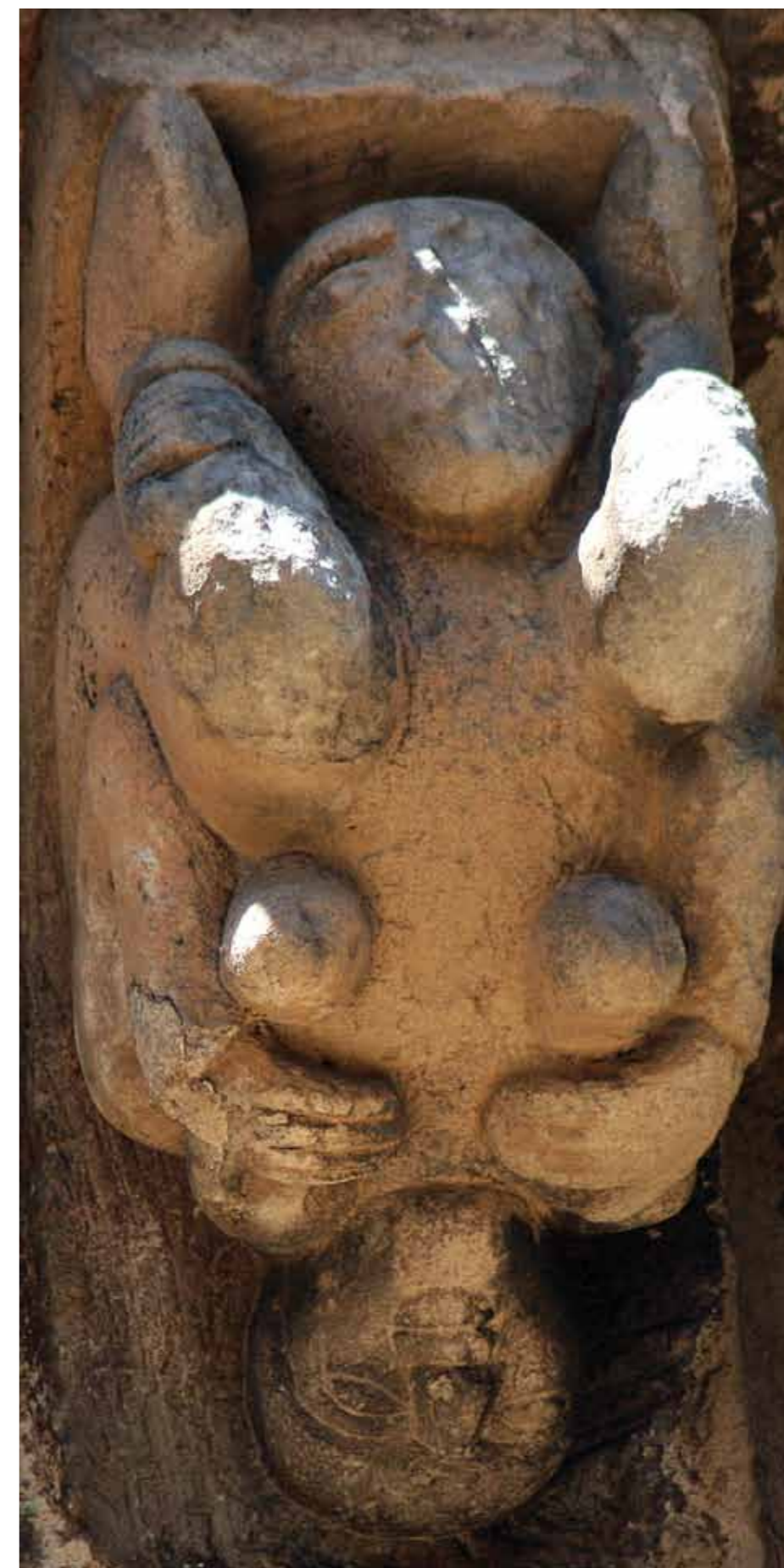
Cervatos. Detalle canecillo erótico.