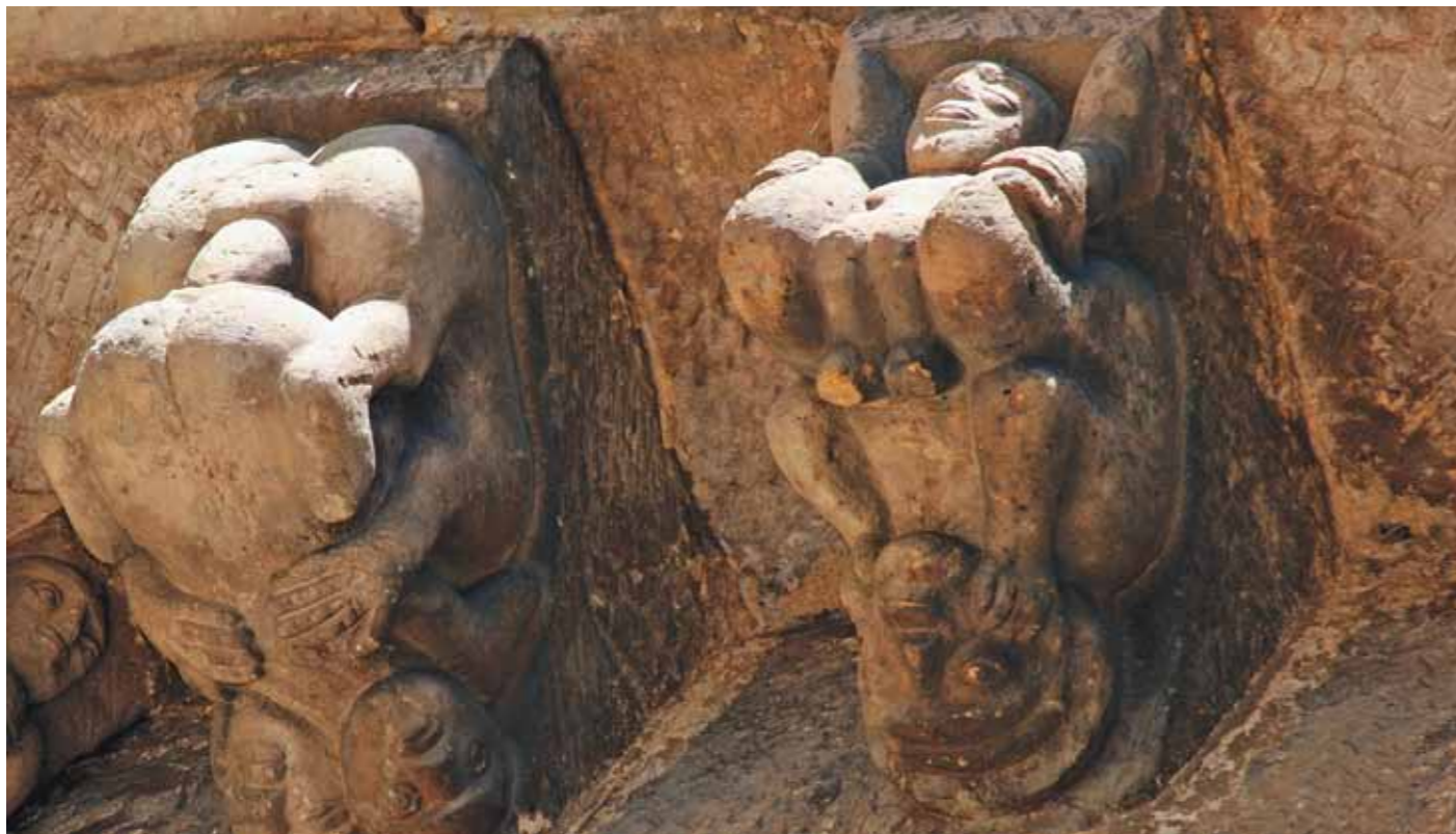
Cervatos. Detalle canecillo erótico.

truido entre los años 1025 y 1050 siguiendo las pautas del estilo artístico de la cultura Chandella. En todo su conjunto, tiene un total de 872 estatuas en alto relieve, de las cuales 646 están colocadas en tres bandas en la parte exterior. En la parte inferior se puede apreciar, entre otras imágenes, el macho simbólico de Shiva, llamado Linga, recostado sobre la hembra Yoni.