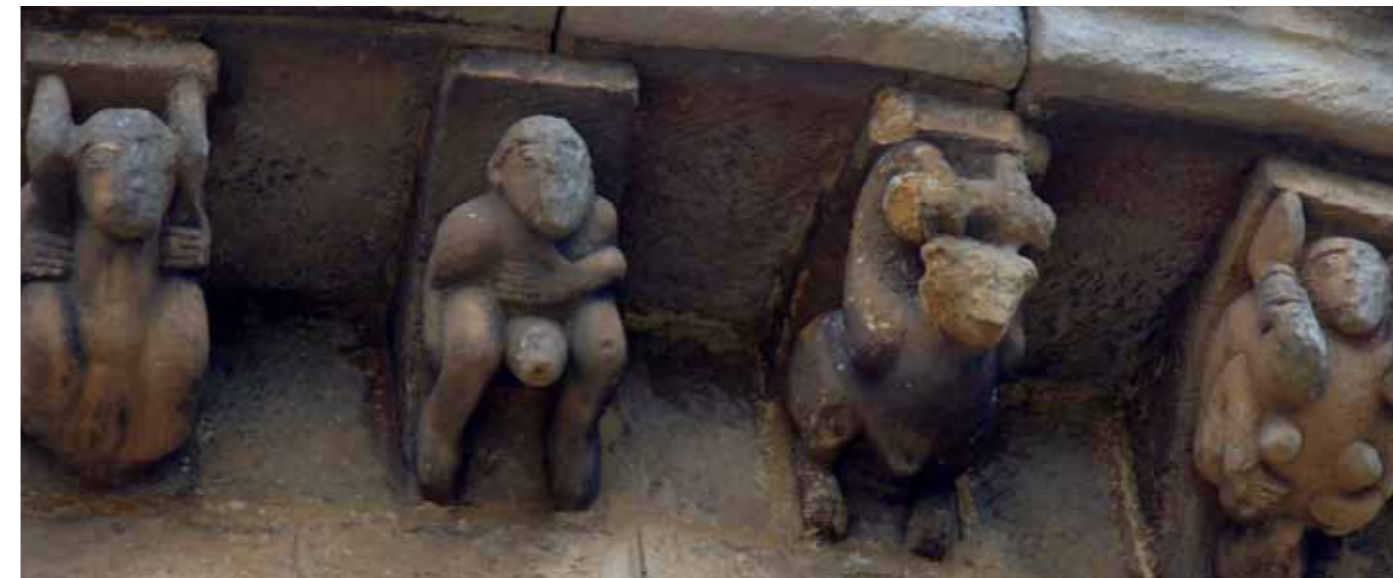
Cervatos . Colegiata de San Pedro.

En el desarrollo del arte románico, cada vez se aprecian más representaciones de pecados en los capiteles u otros lugares de las iglesias. A pesar que la Iglesia medieval diferenciaba entre pecados masculinos, propios del ámbito profesional como la usura, y pecados femeninos, encerrados en el ámbito doméstico como la murmuración, el exceso en el hablar, la pereza; la verdad era que con mayor frecuencia los peca-