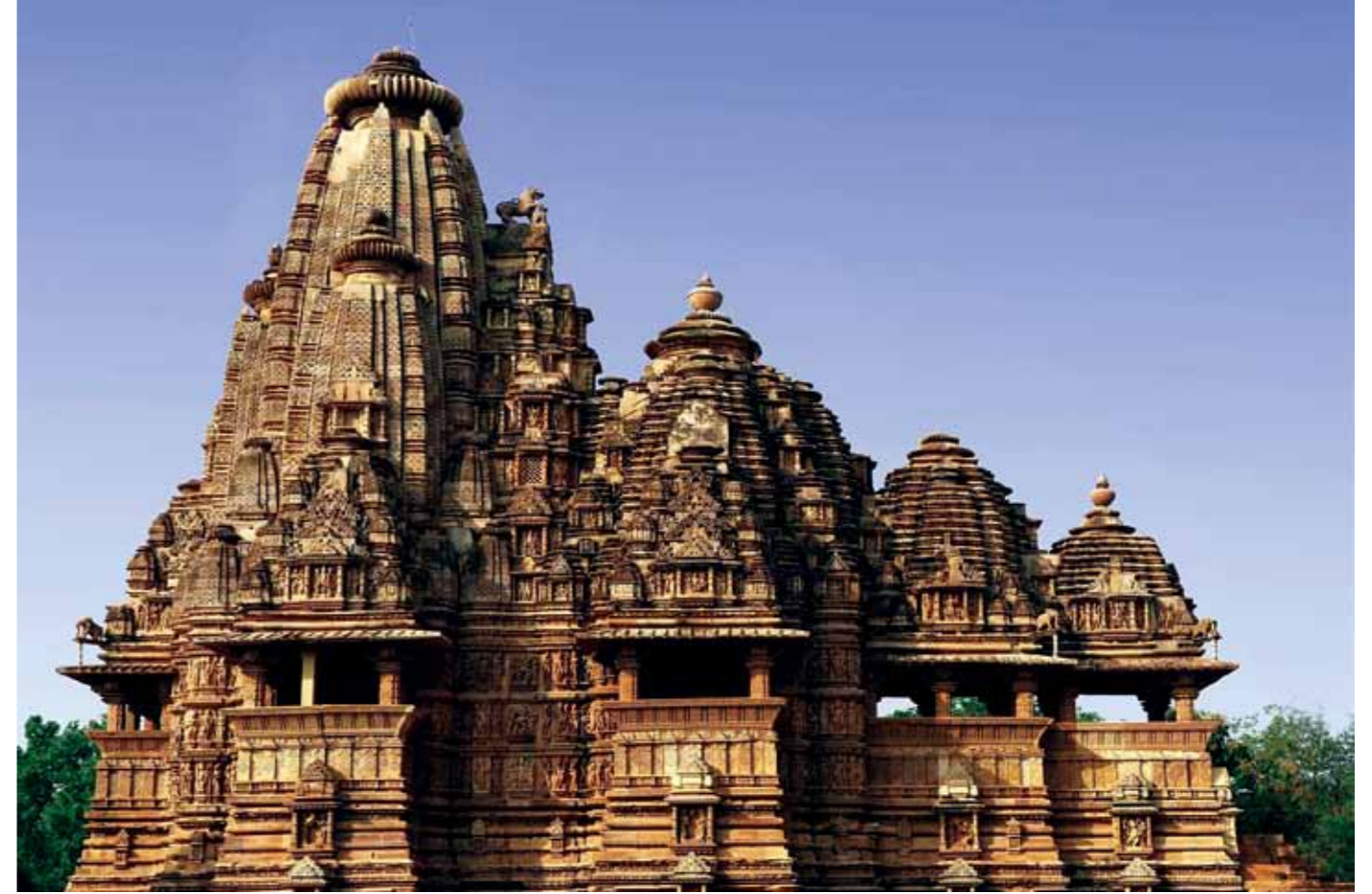
Arriba: Templo de Kandariya.

Al igual que se ha explicado los motivos de la aparición de representaciones eróticas en las iglesias románicas,