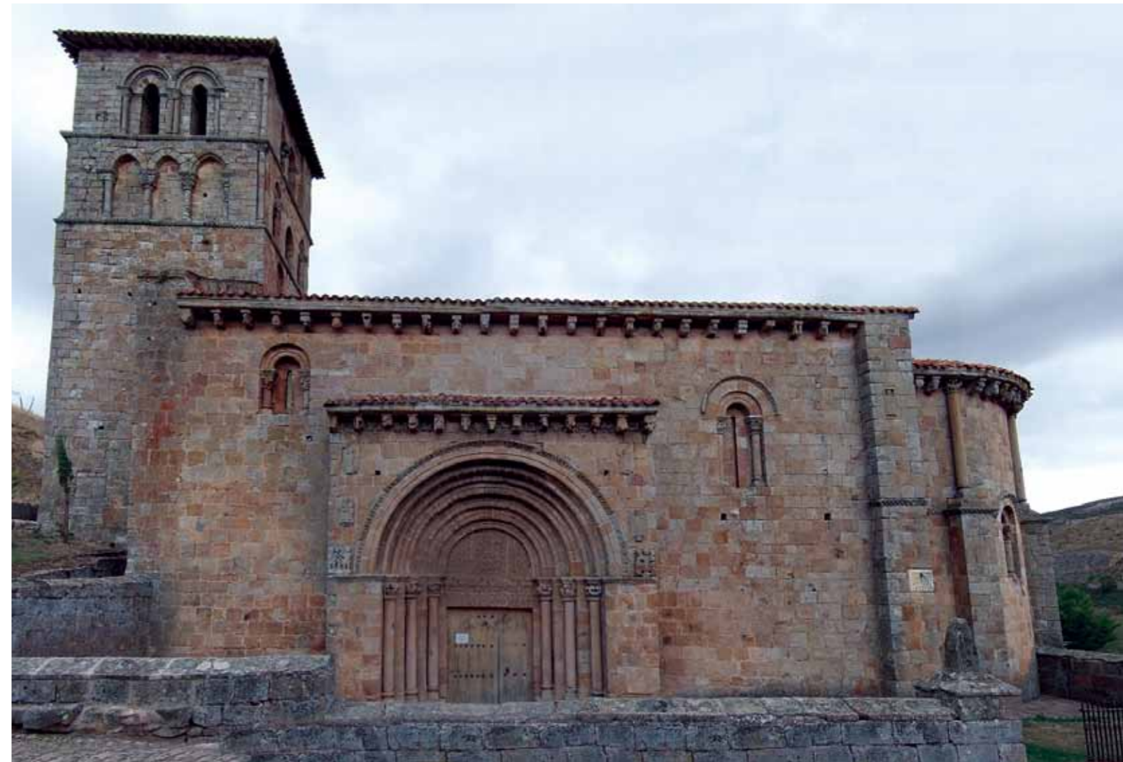
Colegiata de San Pedro de Cervatos