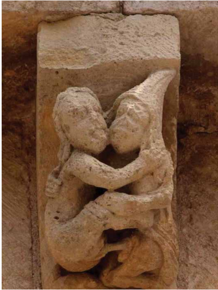
Fuentidueña. Detalle canecillo.

vas son las formas de hombres itifálicos, siendo estos onanistas o no, o en su defecto sustituyendo el hombre por un mono; mujeres solteras o casadas (con toca) mostrando su sexo sin ningún pudor aparente, hombres y mujeres realizando el coito, o también el coito llevado a cabo por animales. Amén de otro tipo de iconografía representada por juglares, músicos, bailes, que tienen un papel directo e indirecto en el erotismo.