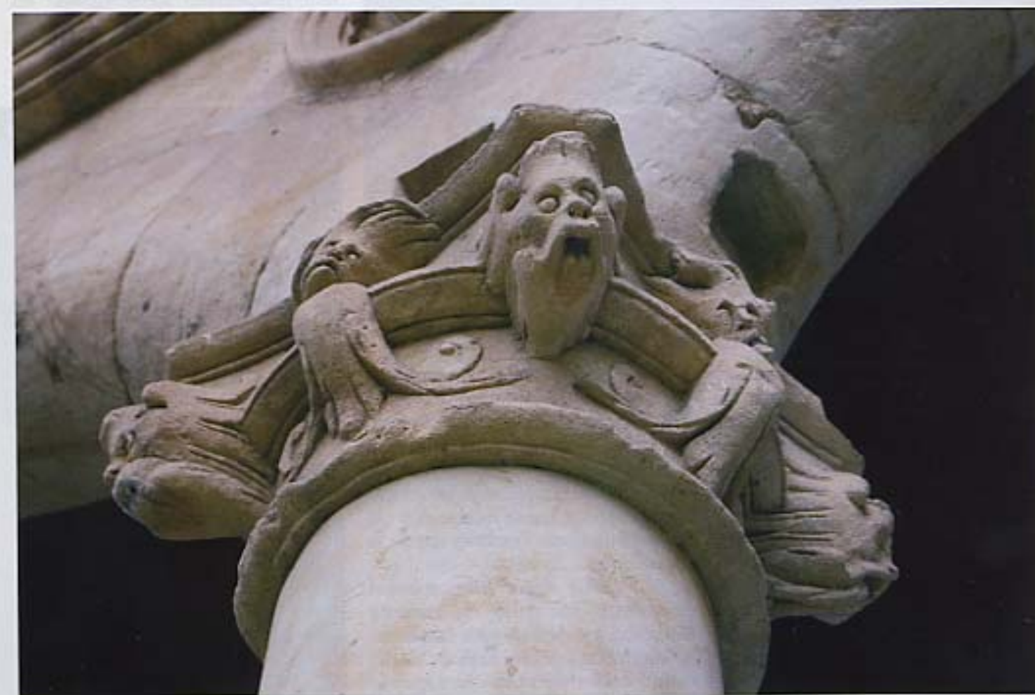
Capiteles de la galería inferior.