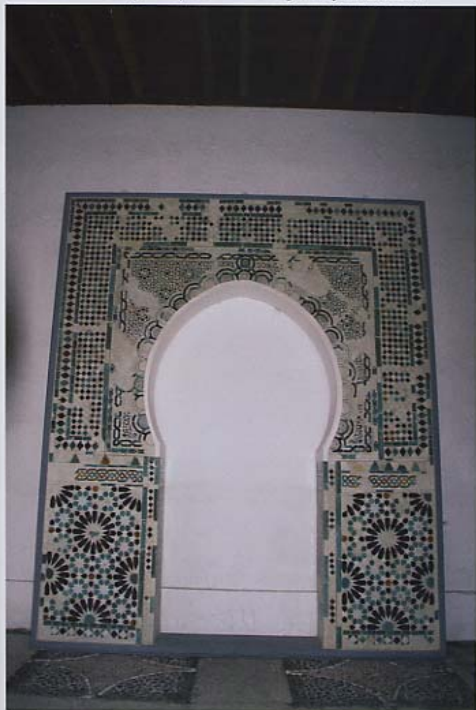
Puerta mozárabe de arco apuntado que se encuentra en la galería superior del claustro.

En el centro, y debajo de la figura principal, se sitúa la cabeza de un anciano que puede representar los recuerdos y la añoranza de una vida pasada, a punto de finalizar. Posiblemente la representación de sus ojos tristes y cansados refuerza dichas connotaciones simbólicas. Debajo del busto del anciano y en el lado izquierdo, la figura de ave con cabeza humana, y con el rostro más joven, puede tener el papel de guía hacia la vida eterna, como ya se ha comentado en otros capiteles anteriores. La fruta en forma de racimo, agrupada, representa la edad madura, la vejez que está a punto de extinguirse. 卐