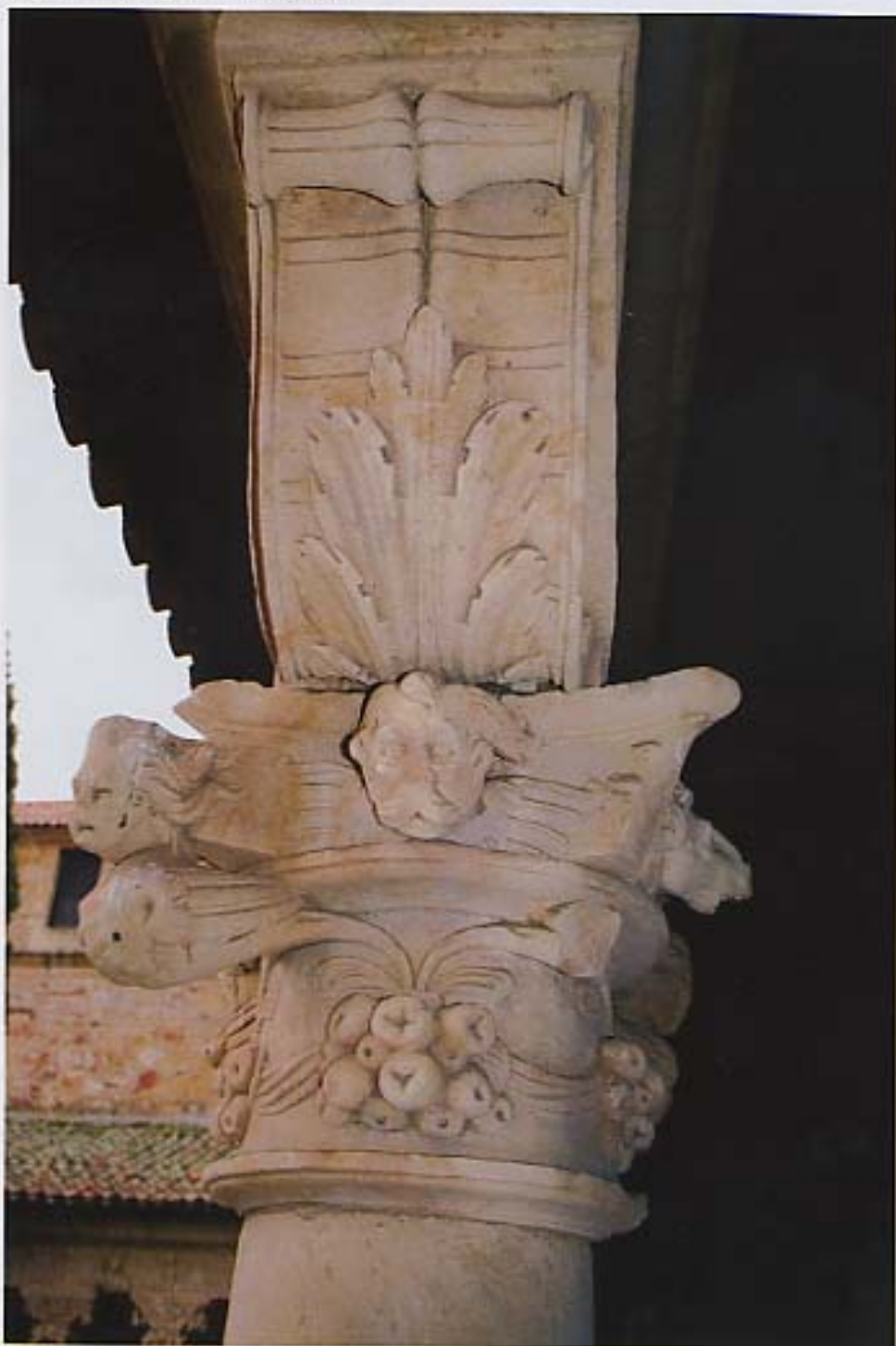
Capitel "Tema vegetal" - Vista lateral.

La forma de las colas de serpiente de los seres alados, que al final se unen con un nudo o lazo, recuerda a una cinta. El simbolismo de la cinta-serpiente con el entrelazado (como en esta ocasión), posee un significado ambiguo. Si por un lado es el nudo de la vida y por eso goza