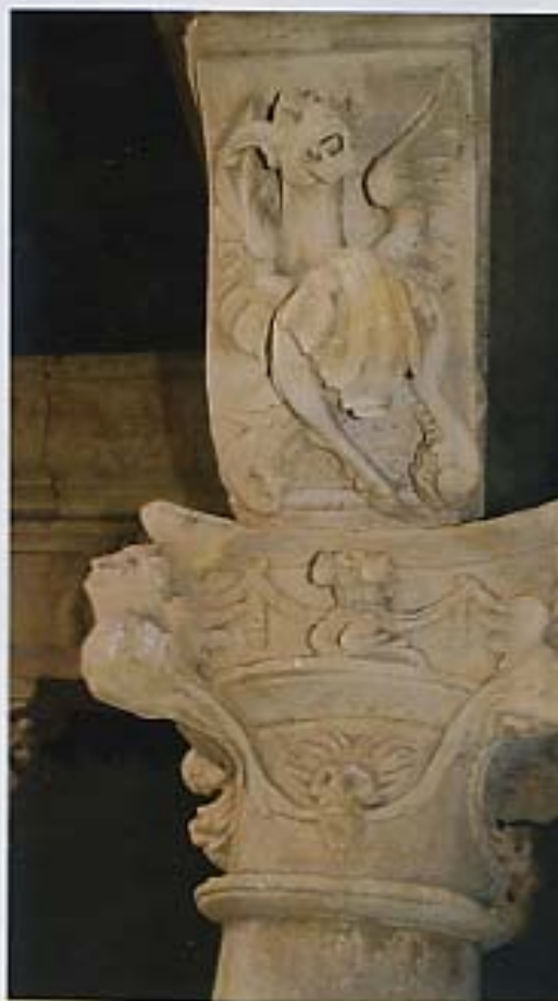
Capitel "Animal fantástico" - Vista lateral

nubes y también mirar fijamente al sol. Por este doble significado goza de la connotación simbólica de la espiritualidad de los estados superiores. En la Edad Media se la identificaba con Cristo, el cual significa la elevación y la realeza; y posee la propiedad de regeneración espiritual. En este periodo de la historia también se vincula el águila con la visión de Dios, se compara la plegaria con las alas elevadas hacia la luz. El águila lleva a sus hijos sobre las alas extendidas a lo alto del cielo, para enseñarles a mirar el sol, y no quiere a los que no pueden aguantar