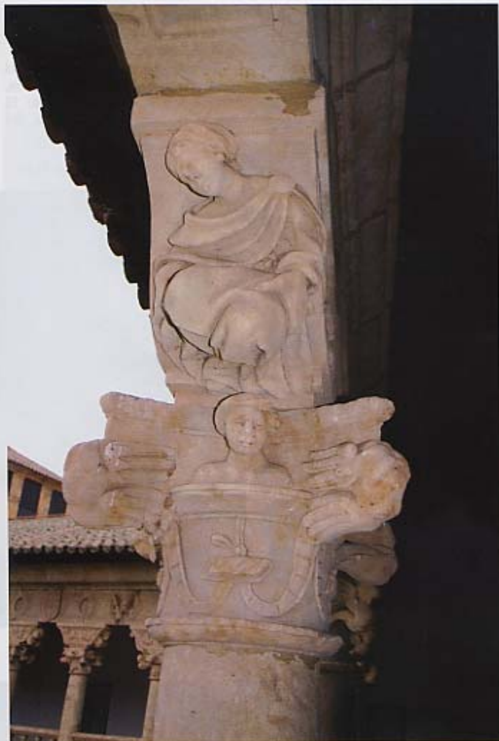
Capitel "Silueta femenina - Vista lateral.

universo; como si el guerrero que lo llevara enfrentase el cosmos a su contrincante y, al mismo tiempo, los golpes de éste alcanzasen la realidad misma dibujada en el escudo. En el Renacimiento, el escudo representa el atributo de la virtud de la fuerza, de la victoria, de la sospecha y de la castidad.