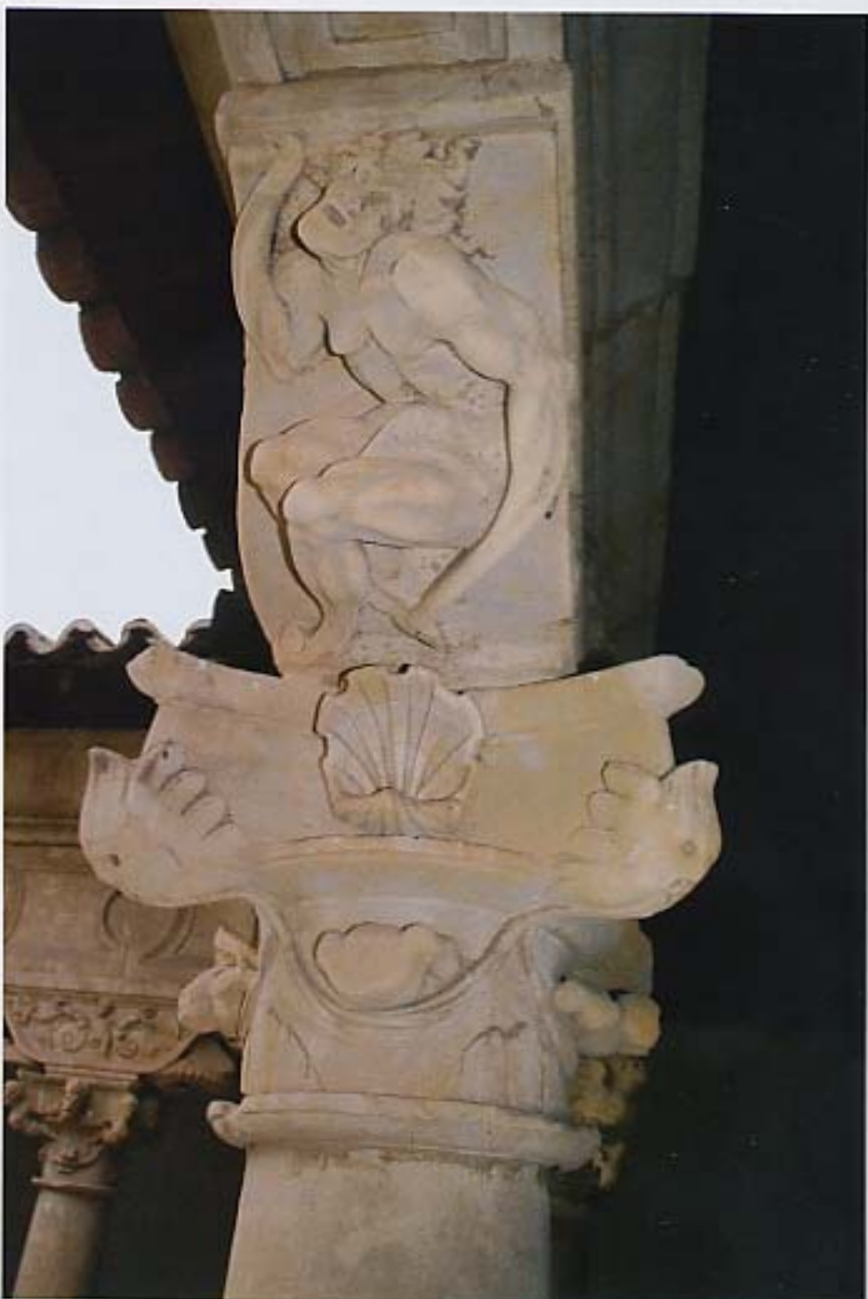
Capitel "Silueta deforme" - Vista lateral.

El fruto, está vinculado con los distintos estados de las edades de la vida. En ese caso, al tener las hojas hacia abajo, y con una forma redondeada y lisa, ofrece el simbolismo de la madurez previa a la muerte del ser humano. El fruto puede ser sexuado, es decir, representar según su fisonomía el sexo del ser humano,